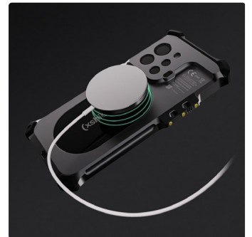
Carregamento sem fios